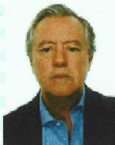
Fotografía del titular Photograph of the holder

TÍTULO EXPEDIDO EN VIRTUD DE LO DISPUESTO EN EL CONVENIO INTERNACIONAL SOBRE NORMAS DE FORMACIÓN, TITULACIÓN Y GUARDIA PARA LA GENTE DE MAR 1978 EN SU FORMA ENMENDADA.